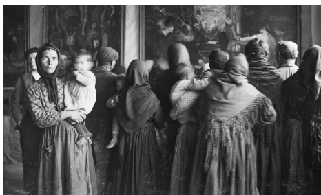
Grupo de espectadores ante una copia de Las hilanderas de Velázquez, en Cebreros (Ávila). Hacia el 15 noviembre de 1932. Residencia de Estudiantes, Madrid

Organiza: Oficina de Cultura y Turismo en colaboración con La Residencia de Estudiantes.