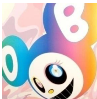
And Then Rainbow, 2005 (Litografía)