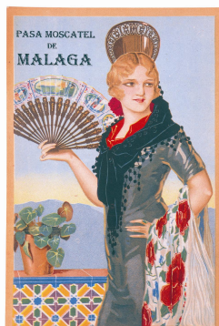
Pasa moscatel de Málaga, 1930. Málaga