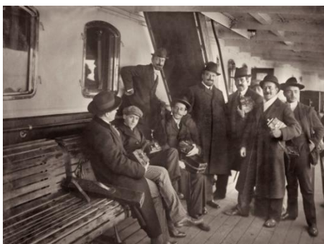
Blasco Ibáñez con fotógrafos. Buenos Aires, 1910.