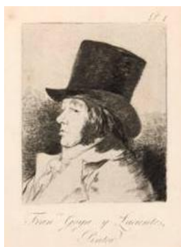
Capricho Nº 1. Francisco de Goya y Lucientes