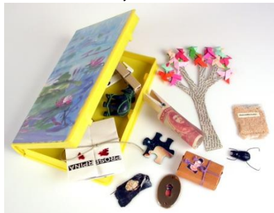
CAJA DE TRUENOS. Nº. Verano 1997. / Edita: Colectivo Alcandoria y Antonio Gómez. / Mérida (Badajoz).