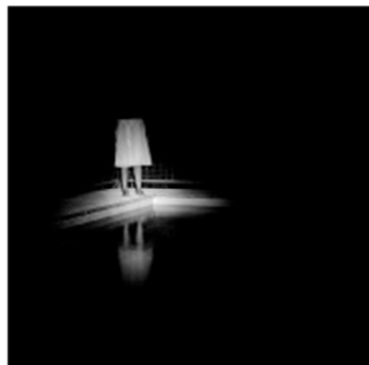
Francisco Villar Vázquez. El bosque (Olga y la piscina) , 2006. Colección CA2M