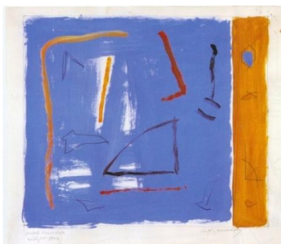
Proyecto pintura mural Eina (2), 1994. Gouache sobre papel