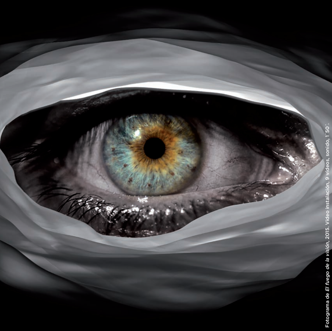
Fotograma de El fuego de la visión , 2015. Vídeo instalación, 9 vídeos, sonido, 1'50''