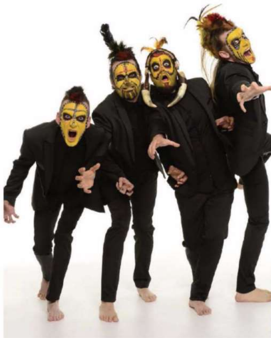
Primitives. Hasta el 30 de diciembre en el Teatro Alfil de Madrid.

Da igual lo que la cartelera del Teatro Alfil anuncie. En Madrid existe la sensación de que el mejor plan pasa por ir al Alfil, confiando siempre en lo que los Yllana programen. Este mes de diciembre podemos disfrutar de Primitives , un espectáculo musical que mezcla la maravilla de los cantantes a capela con la dirección gamberra de Yllana. Los Primitives Brothers proponen un viaje melódico aderezado con toques de humor, muy capaces de sembrar la carcajada en el público.