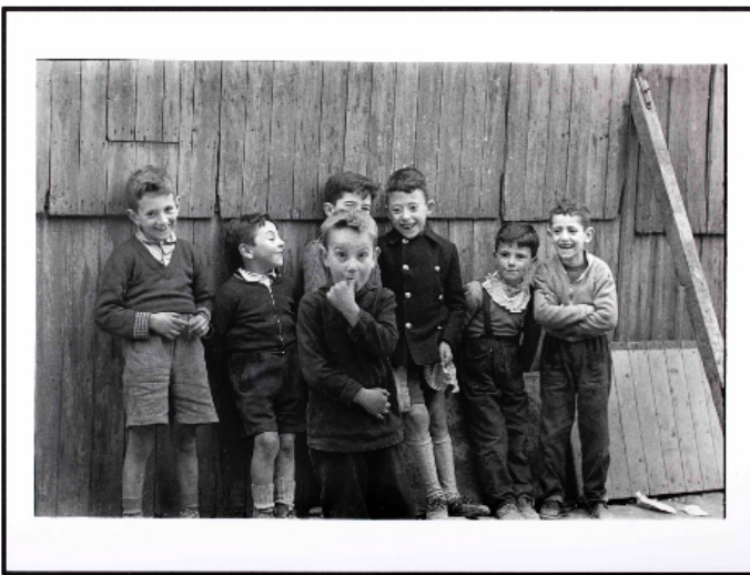
[Barcelona] , c. 1958

Me quedé tan sorprendido y emocionado que supe que tenía que dedicarme a eso.