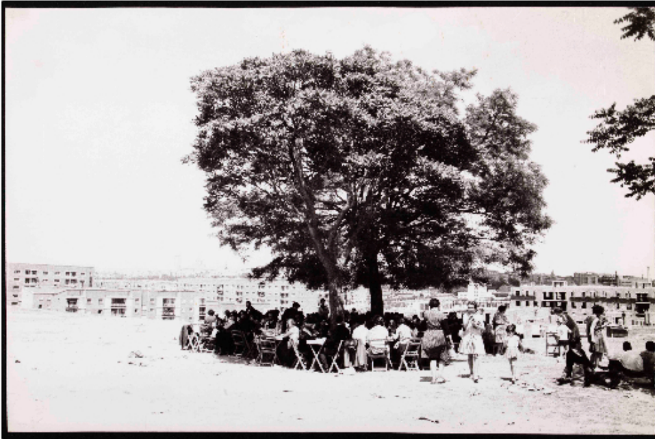
[Vivir en Madrid], 1966-1967