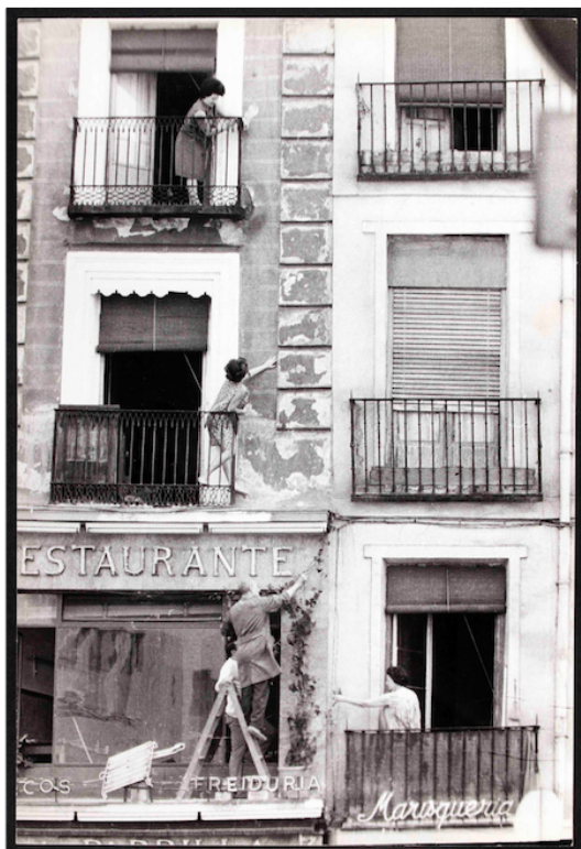
[Vivir en Madrid], 1966-1967

En sus reportajes retrató a todas las personalidades de la época. Viajó por todo el mundo, incluso llegó a perderse cinco meses en Asia en 1963. Trabajó con los más prestigiosos periodistas. Sus fotografías llamaban la atención y llegaban a tomar protagonismo sobre el texto.