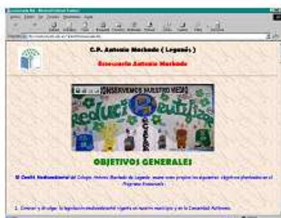
Página web de una Ecoescuela

7.- BANDERA VERDE : Los centros participantes, anualmente presentarán una memoria a ADEAC, para su evaluación. Periódicamente se realiza una evaluación de cada centro, mediante el análisis de los informes presentados por los centros y/o visitas de asesoramiento. Los centros participantes que desarrollen satisfactoriamente el programa serán galardonados por un período de tres años, con un Diploma y una Bandera Verde. Ello significa un reconocimiento de la política ambiental seguida en el centro.