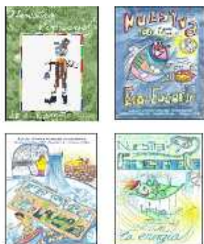
Revistas de una Ecoescuela

6.- INFORMACIÓN Y COMUNICACIÓN : Una adecuada política de comunicación debe conseguir que los trabajos y resultados en los distintos centros sean conocidos por la comunidad escolar y local, así como por otros centros de la RED de Ecoescuelas.